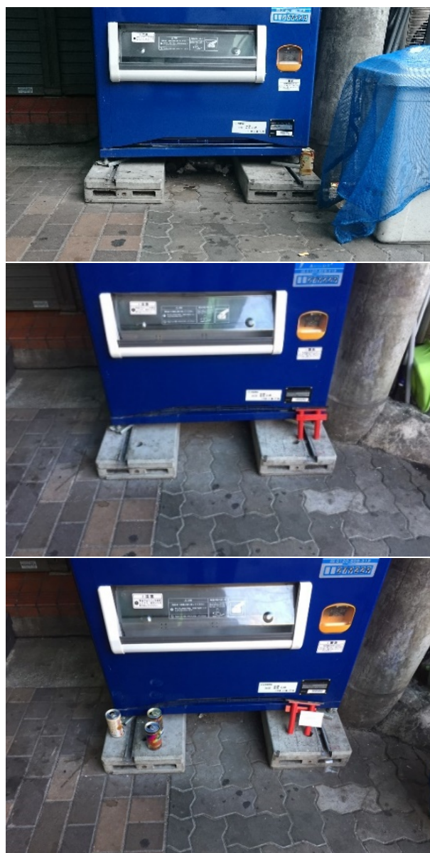
図 2: 実験の様子。上から「何ものなし」、「鳥居」のみ、「鳥居と日めくりカレンダー」。

実験の様子は図 2 に示す。曜日による影響を取り除くため、それぞれの条件について一週間連続して計測を行い、第 1 週から第 6 週まで 1 → 2 → 3 → 3 → 2 → 1 の順序とした。計測期間は 2018 年 11 月 1 日から 12 月 12 日の 6 週間としたが、11 月 2 日は事情により計測不可能であったため欠測している。